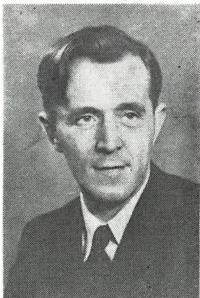
Den nye formannen.

Seniorrådet skal bestå av 12 medlemmer + æresmedlemmene.