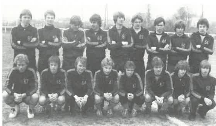
Juniorlaget 1980 som vant juniorturneringa i Paris 1980