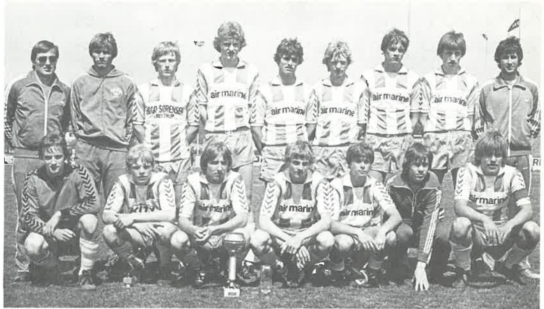
Randers Freja som i finalen vant 5-1 over Neukölln.

Starts juniorutvalg hadde invitert Neukölln fra Vest-Berlin, Aalborg Boldspilklub, Randers Freja og Kalundborg Gymnastik & Boldspilforening fra Danmark, samt de norske lagene Viking, Strømmen og Vålerengen til sin jubileumsturnering for juniorlag i pinsen.