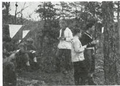
Fra et propagandaløp i 1951.

Hans forlovede tok bronsemedalje i Norgesmesterskapet for damer 1955, så interessen for orientering er sikkert i orden der i gården.