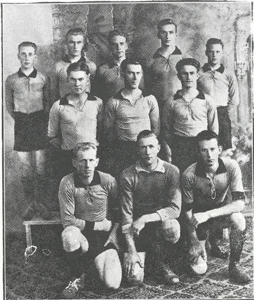
Starts A-lag ved 25 års jubileet i 1930.