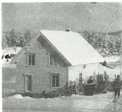
Start's skihytte på Skrerros.

ledige stunder. Eller skal en vedlikeholde formen og gå i gang med andre idrettsgrener som passer for årstiden.