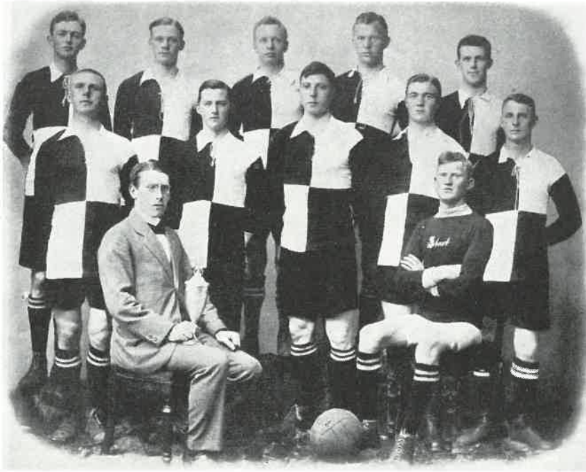
Laget av 1916.