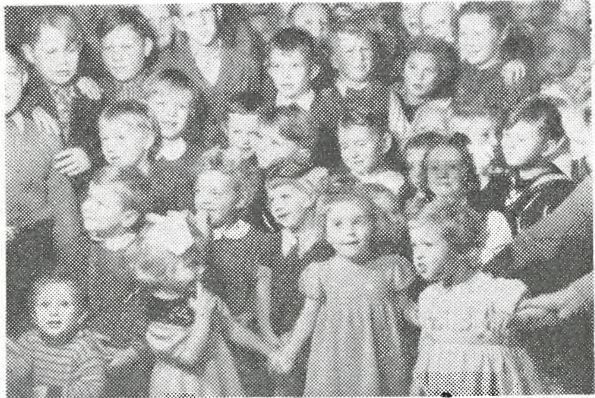
Mange vil i den glade barneflokk muligens kjenne igjen sin egen håpefulle pøde. Bildet er tatt under barnefesten i Totalen og viser en gruppe festklede små en alen lange.

Dameavdelingen arrangerte midt i januar den tradisjonelle juletreffest for barn og voksne, denne gang i Totalen. Barna slapp til alt tidlig på ettermiddagen. Blant de ca. 130 fremmøtte var mange så små at de hadde foreldrene med. Ved bordet ble barna traktert med kaker og sjokolade eller melk etter smak. Flokken rundt juletreet ble temmelig stor, og det lot til at det gjaldt om å synge høyest. Siden underholdt to piker med sang og musikk, og da det ble gitt en premie til hver, stod der til slutt kø av unge amatører som ville prøve seg på podiet. Festens høydepunkt var likevel da julenissen kom med epler, og enda nissene var oppdressede i røde drakter med skjegg og alt tilbehør, påstod en liten pjøkk at det var «junior-guttane».