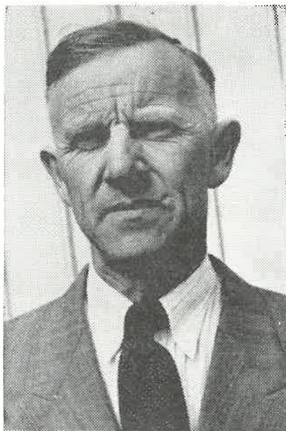
Davidsen i dag