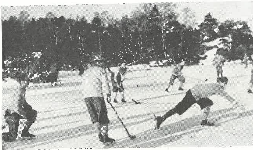
Fra en av årets bandykamper