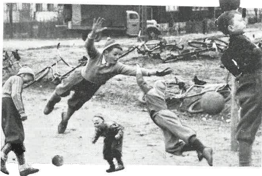
Løkkefotballen dyrkes enda rundt om i Kristiansand.

Fra mange hold blir det klaget over vanskelighetene med å få idrettsungdommen til å trene om de ikke får forholdene lagt til rette for seg, uten å gjøre noe forhåndsarbeid selv. — Selv om dette ikke er noen almen utbredt foreteelse, kan det i alle tilfelle med sikkerhet slås fast at tendensene er til stede og vel også utvides dag for dag.