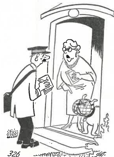
— Ja, den har fått munnkurv på seg nå for den ble syk sist den bet Dem.

vannsbeholder (100 liters kapasitet) på kjøkkenet. Ellers har vi i et forslag til instruks for komitéens medlemmer slått til lyd for en ny vaktordning. Den går kort og godt ut på å fordele vaktene på 40—50 vilige, mens en hyttekomité på 5—6 medlemmer har nok med oppsynet. Slik som ordningen er nå, blir en fast gjeng sittende med hele arbeidet. En forandring må til, slutter et ellers så fornøyd hytte-ansikt.