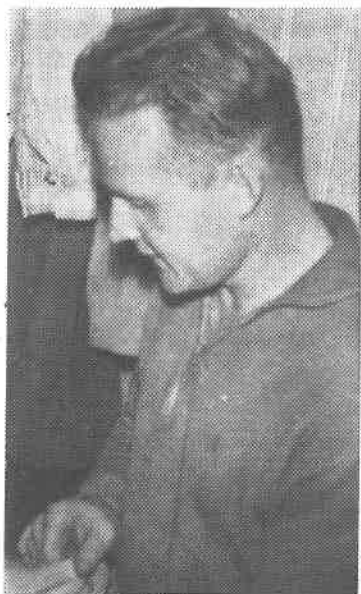
Er det frisparket mot Greåker han tenker på?

Til slutt foreslo han at det velges tre av guttene til kontaktmenn mellom spillerne, trener og styret. Gut-