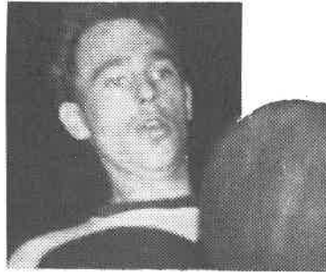
Tore konsentrerer seg om teknikken. Holder den for en plass på laget?

Uten sammenligning forøvrig, så har det sett svartere ut før, men