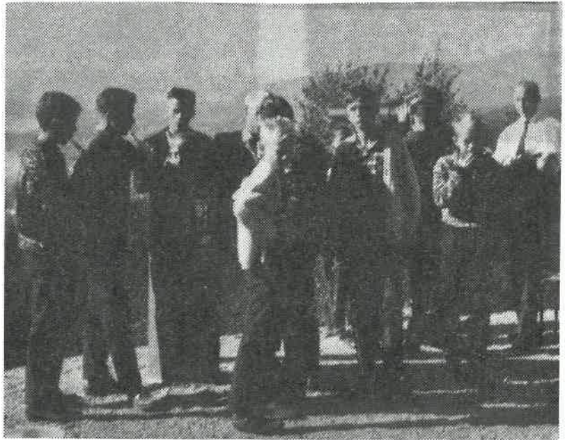
Endel av småguttespillerne fotografert med den flotte utsikten fra Spiralen i Drammen.

Det var en spent gutteflokk som dro fra Kristiansand fredag den 20. september på en 4 dagers Østlandstur med en av Vågsbygdrutas fine turbusser.