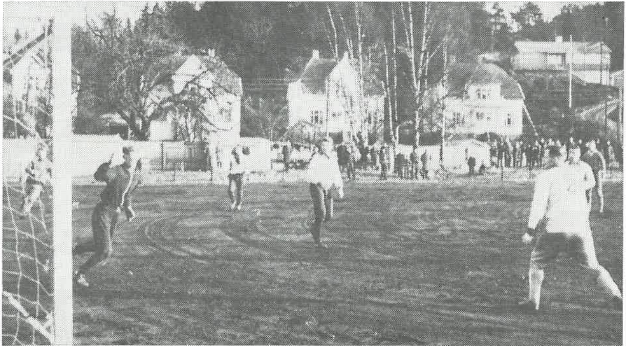
Årets første Start-mål i en seniorkamp mellom første- og reserve-lagsspillere. Det er Føreland som ser langt etter en «suser» fra Kåre Drøsdal.