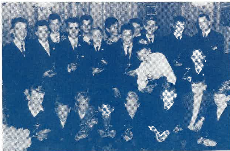
Det var stor stas på festen for småguttene da de flotte statuettene ble delt ut som premie for ekstra god innsats i 1963.

Småguttene markerte sesongslutt med en hyggelig avslutningsfest på