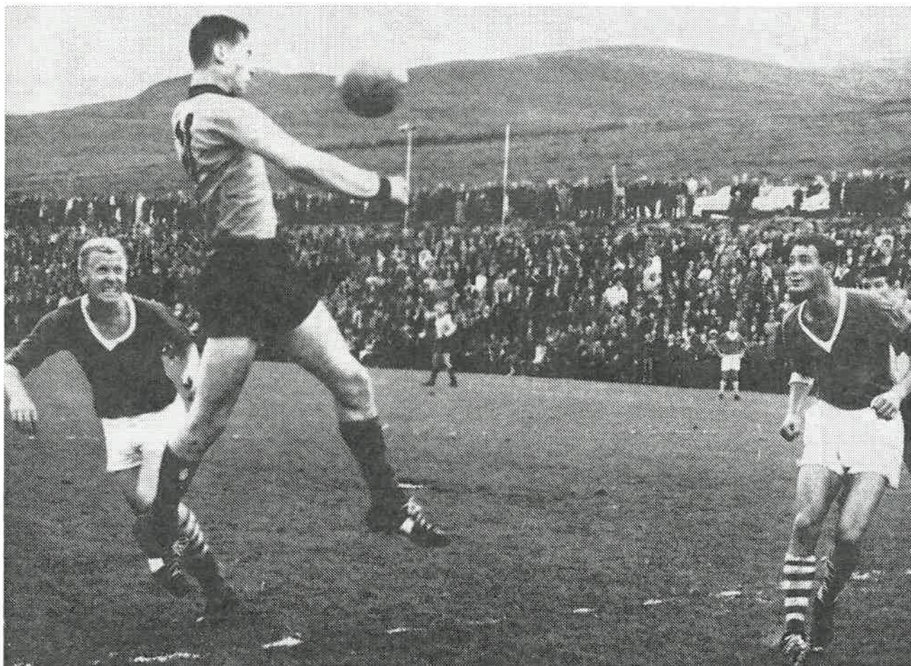
Ivar tar det store overblikket mot Hødd i Ullsteinvik. — Det kan bli lenge til neste gang!

Også i år fikk vi en baksmell i norgesmesterskapet. Mens vi i fjor tapte relativt beskjedne 1—2 for Mandalskameratene, føyk vi i år ut med hele 1—6, og det var Vigør som var eksekutøren.