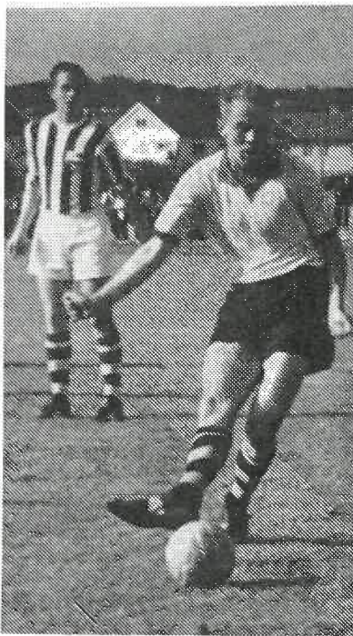
Harald lager 1—0 mot Sarpsborg.

Et plusspoeng: I kampen mot Sarpsborg dominerte Start totalt og bare dyktig keeperspill og manglende skuddkonsentrasjon hos våre løpere, hindret Sarpsborg i å reise hjem med et stort nederlag. Mot Donn ble det hyggelige 7—2, og i