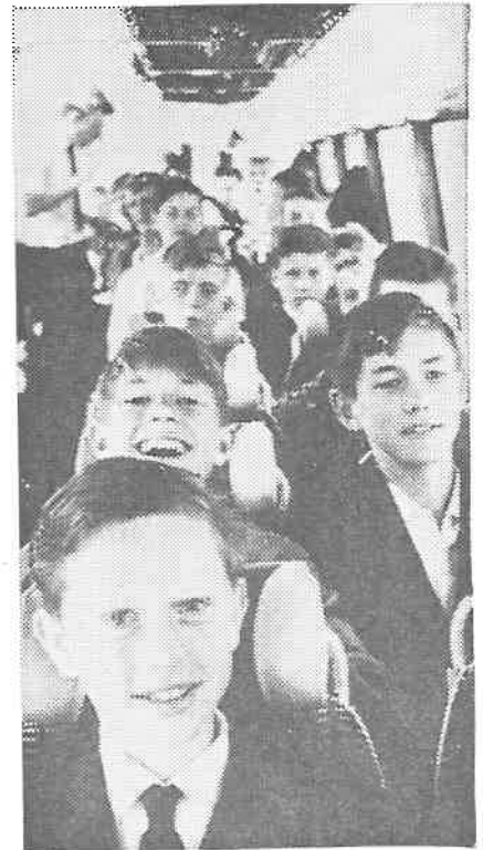
Om lag 40 gutte- og småguttspillere var med på Larvik-turen, og på det store bildet er guttene fotografert før turen startet i Kristiansand. Under et glimt fra bussreisen.