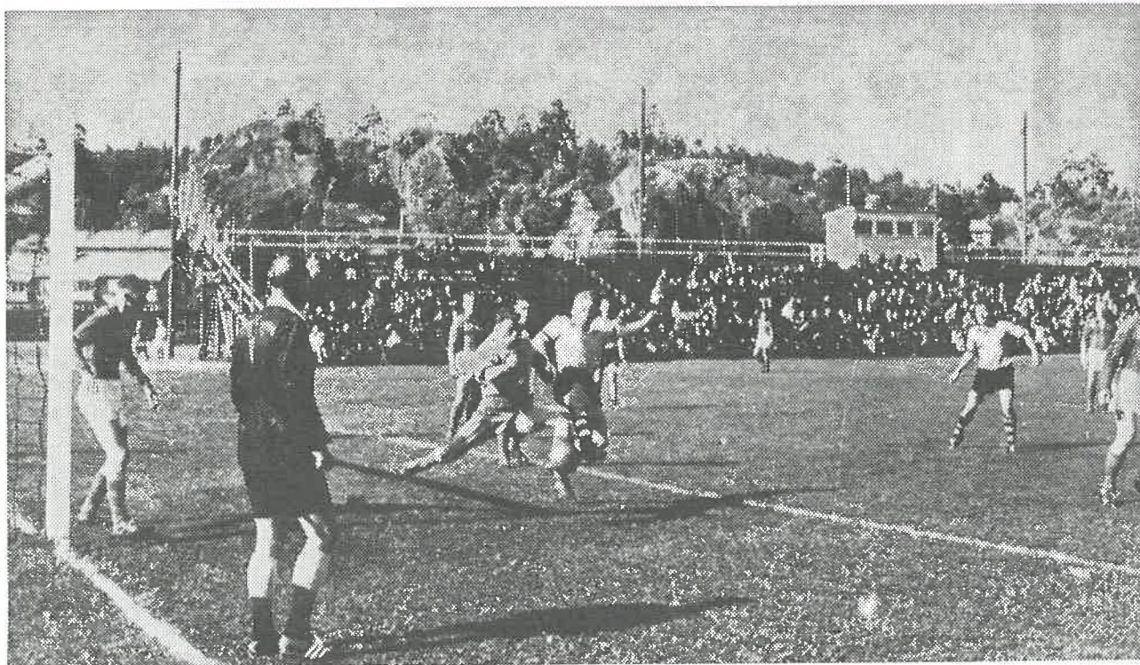
Fra kampen mot Fram i Larvik. Start innkasserte her som kjent sin 2. seier i vårsesongen 1964.