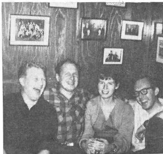
Arkivbilde som viser en glad flokk startere i godt lag på hytta.