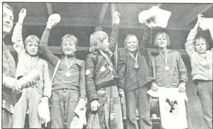
Glade Chelsea spillere, sølvmedalje.