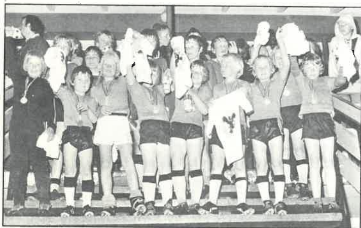
Glade miniputter TOTTENHAM, sølvmedalje.