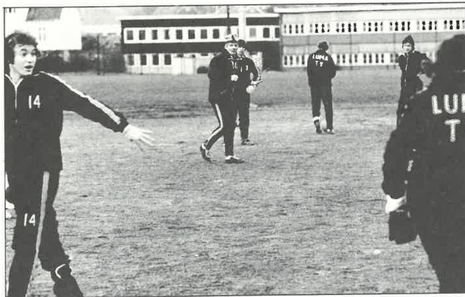
Treningen har pågått ute i hele vinter.