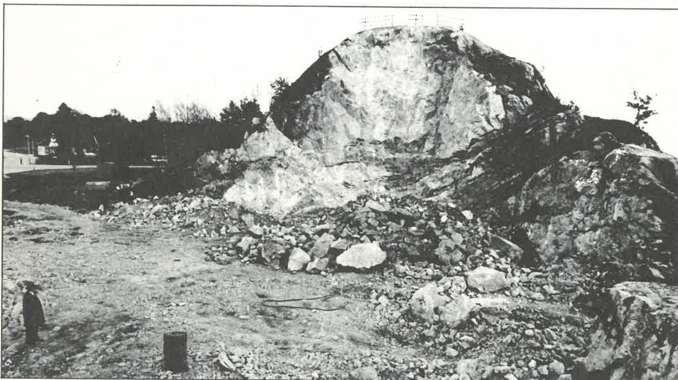
Arbeidet går for fullt og grunnstenen ventes omkring 5. mai.

En ca. 20 meter høy, loddrett fjelskrent vitner om at det er blitt sprengt vekk atskillige kubikkmeter stein på tomta til Start's klubbhus på Marvikveien.