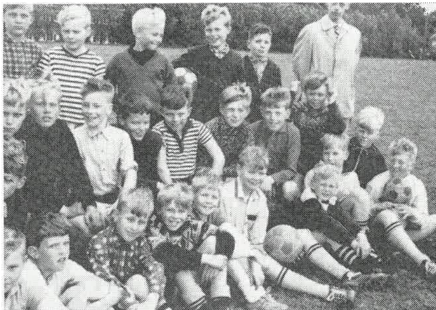
En del av lilleputtene fotografert på treningen.

Gjennom arbeidet i Teknisk komité har jeg inntrykk av at interessen for juniorarbeidet også kunne være bedre i Start. Guttene settes pris på et besøk av en av de som er med på å lede klubben. Det inspirerer guttene til økt innsats. Og jeg har sikkert de andre med meg når jeg håper på at vi av og til kan få se noe mer til de som er med i administrasjonen, og også noen av de eldre medlemmene. Start er vel ikke bare førstelaget?