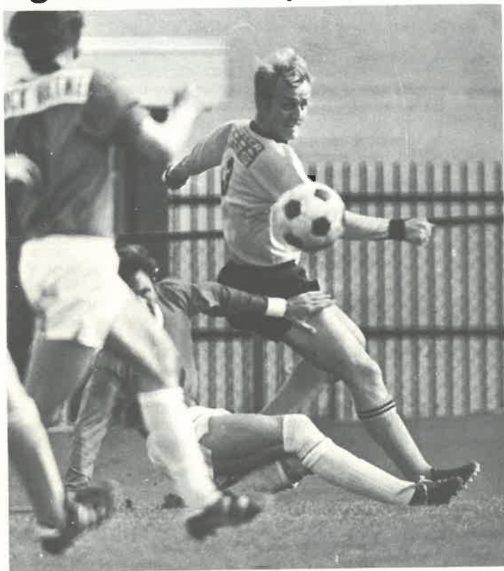
Den lysluggede «fightereren» har fått opplevd sin store drøm — nemlig å være på topp i 1. divisjon.

Starteren som har spilt på alle plasser — også som keeper