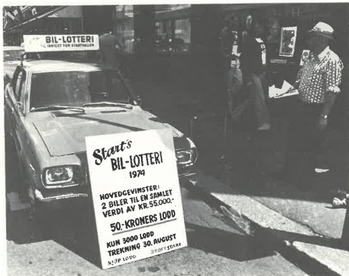
Lotteribilen står i disse dager utenfor Sørlandsbanken.

Til de som vil støtte Start og kjøpe lodder er det anledning til å gjøre nytte av bestillingskupongen.