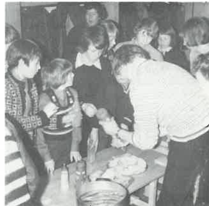
«Den så go ud!»

gikk det med til våre tilstelninger i forrige uke som vi hadde for lilleputter og smågutter. Tre kvelder fikk vi låne kjellerlokalene i Lund Kirke. Vi hadde såvel kjøkken som en hyggelig peisestue til disposisjon. Det ble fortært rundt 600 pølser, drikket 8 kasser brus og nærmere 25 loff ble fortært. Programmet har vekslet med film fra Norway Cup, Englandstur og Danmarkstur — bingo, pianomusikk og konkurranser. Vi vil også gjenta slike sammenkomster seinere. Det er med å sveise medlemmene sammen.