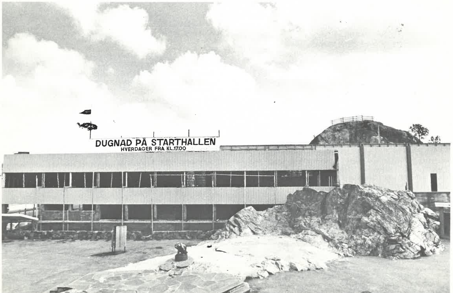
Den nye Start-hallen skal stå ferdig 15. februar