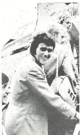
Alle reiser foregår med fly.