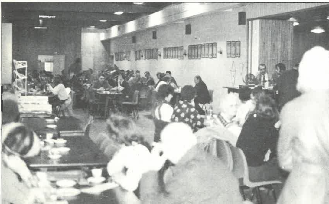
«Fullt hus» på Søndags-Bingo.

— kontingenten har kommet forholdsvis greitt inn. Dersom du ikke har betalt i år, ber vi deg ordne opp i det snarest mulig. Den er i år på kr. 50,- og søskenmoderasjon på kr. 25,- for medlem nr. 2.