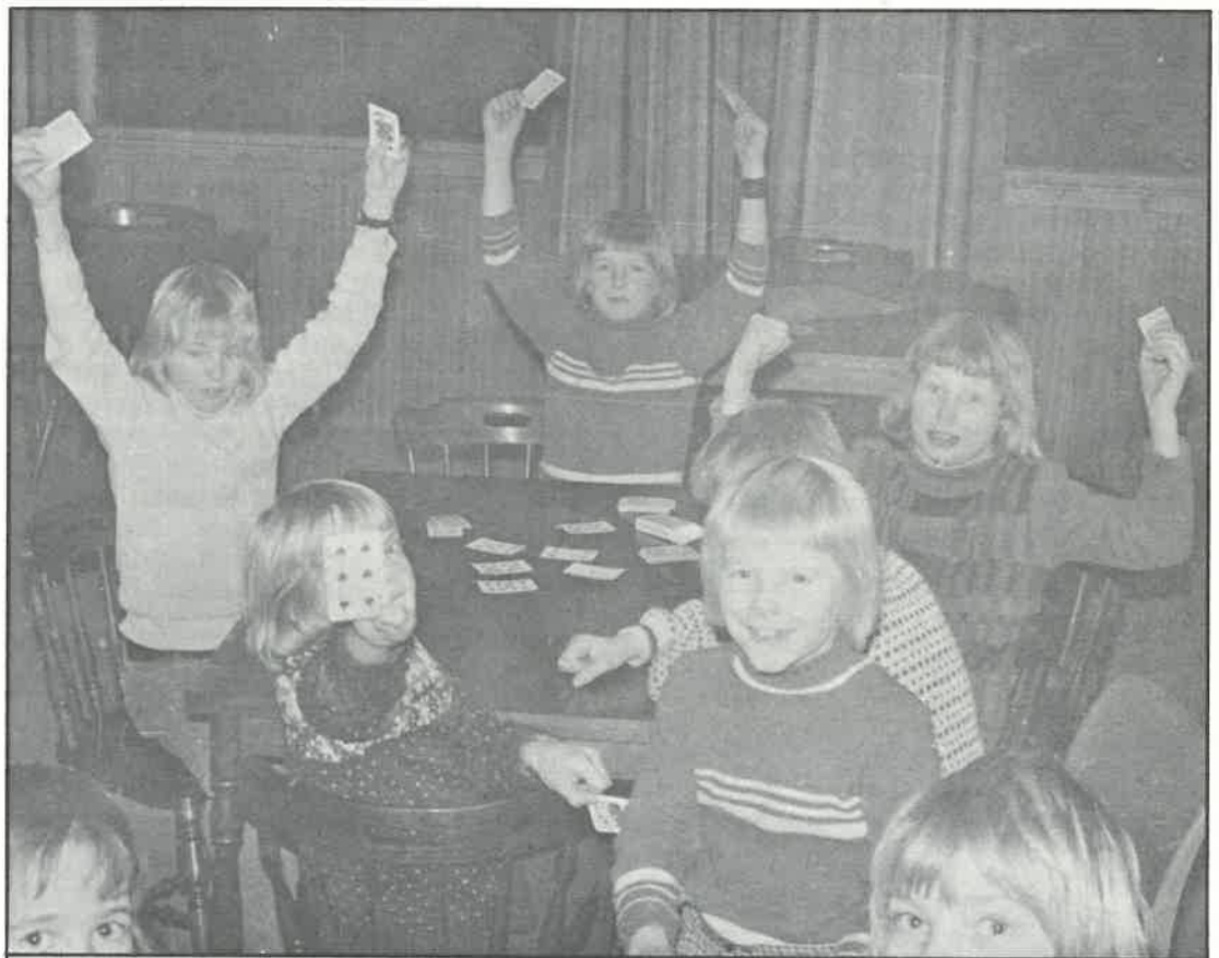
«Vi har det gøy», på en av «Open House»-kveldene.

Ved at vi fikk Starthallen har det gitt oss muligheten til å gi et tilbud til medlemmene også utenom treningene. Vi har i løpet av januar og februar eksperimentert oss frem til et opplegg som ser ut til å falle i smak hos våre yngste medlemmer. Vi hadde fra begynnelsen håpet at det tilbudet ville være passende for de eldste innenfor jr.-avdelingen, men det synes ikke slik. De er vel opptatt med skole og andre ting. Vi synes i allé fall at oppslutningen på kveldene er bra.