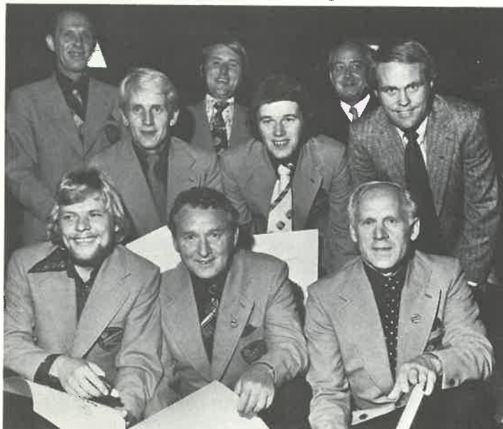
Ni glade gullmerkemenn

Filialer: LUND, Østerveien 30 - ØVRE MARKENS, Markensgt. 44