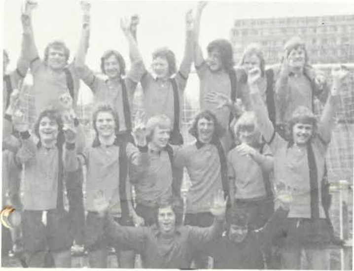
Glade juniorer i den Haag etter at seieren var et faktum.