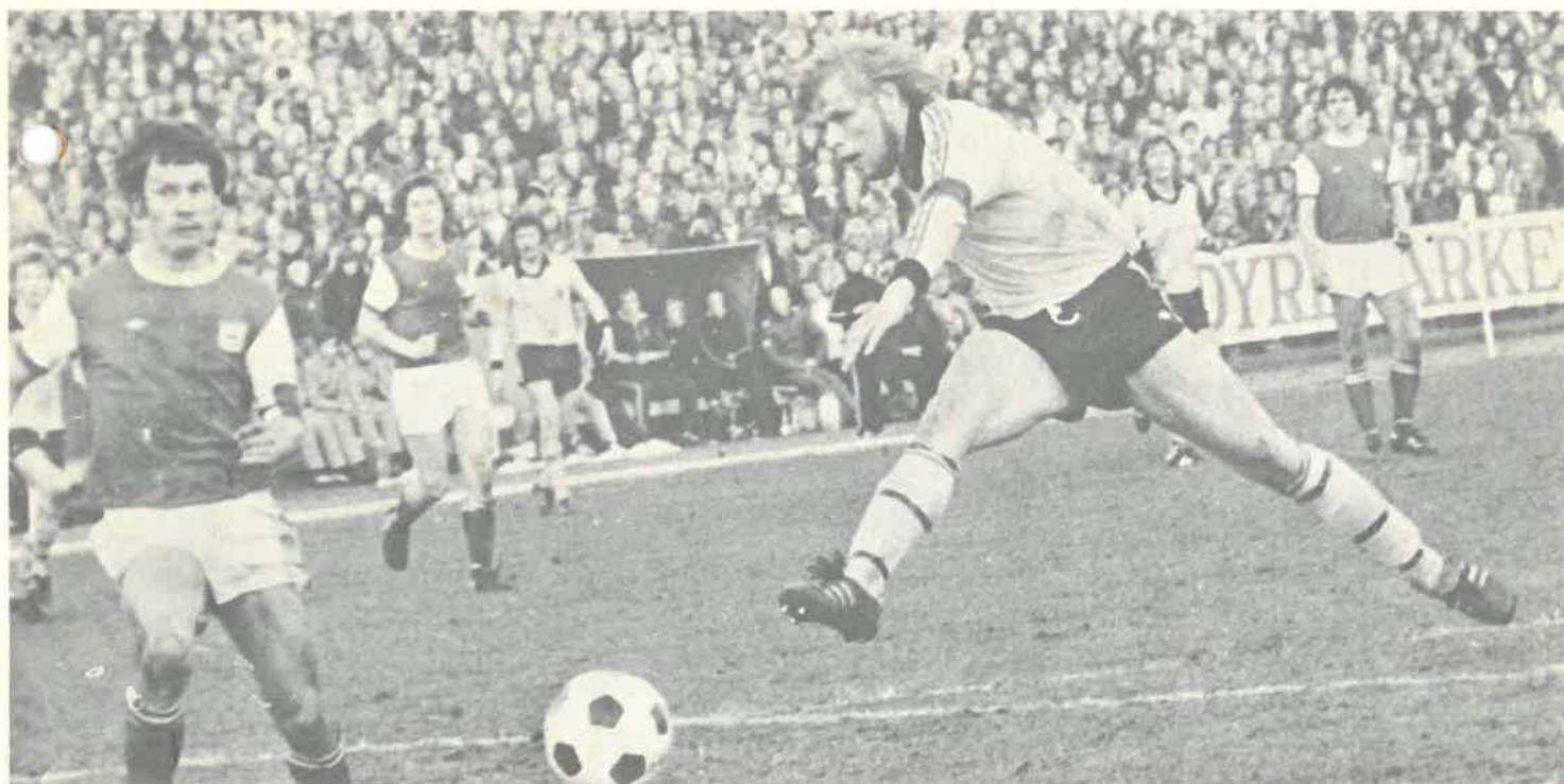
Trond i skuddet — i kampen mot Bryne.

ikke anse noen kamp for tapt på forhånd. Til tross for problemer med gjennomføringen av treningsopplegget og de mange skader, har det gått bra. Laget har vist at det er i besiddelse av den rette fighting spirit og har klart å høste bra med poeng, selv om vi har støtt på diverse vanskeligheter. Jeg håper vi snart skal få se samtlige spillere i sin beste form og at laget slår til for fullt. Med det mannskapet vi rår over, skulle sjansene til å kunne hevde seg godt i høy grad være til stede, mener fotballformannen. «1.83»