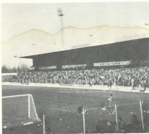
Her var det Stig kom inn med det blå kortet.

Men når vi så nevner at fargen på kortet er blått, så skjønner man kanskje at det ikke var så vanskelig å komme inn. Muligens hadde det gått an og brukt det på SAS-flyet også, man vet aldri!