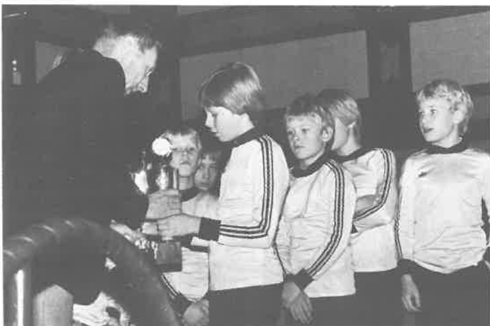
Lilleputtene overrekker pokalene til klubbformannen.