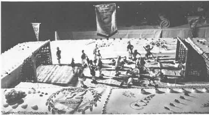
Caledoniens «bløtkake» med det forventede flomlys behørig monteret.