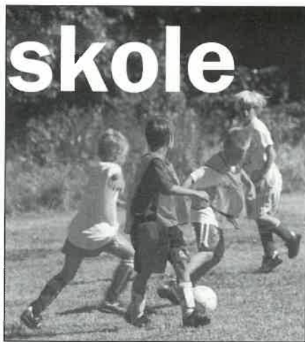
Ingenting i veien med dribleferdighetene hos denne karen her.

- Ved fornuftig tilrettelagte fotballaktiviteter, gjennom organisert lek, trening og