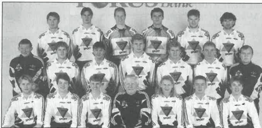
Det er store forskjeller på Kong Salomo og Jørgen Hattemaker i norsk idrett. Rosenborg er den klubben som kan skilte med både størst omsetning og størst overskudd.

Men mens omsetningen ikke øker, er idretts-Norge faktisk i økonomisk balanse når tallene totalt sett summeres opp. Det var både i 1994 og 1995 samsvar mellom utgifter og inntekter. Men det er store kontraster. Der hvor noen fotballklubber (Rosenborg og Molde) har hatt suksess med klingende mynt i kassen som resultat, har situasjonen vært heller mager i skiforbundet. Det har også blitt en økonomisk nedtur for