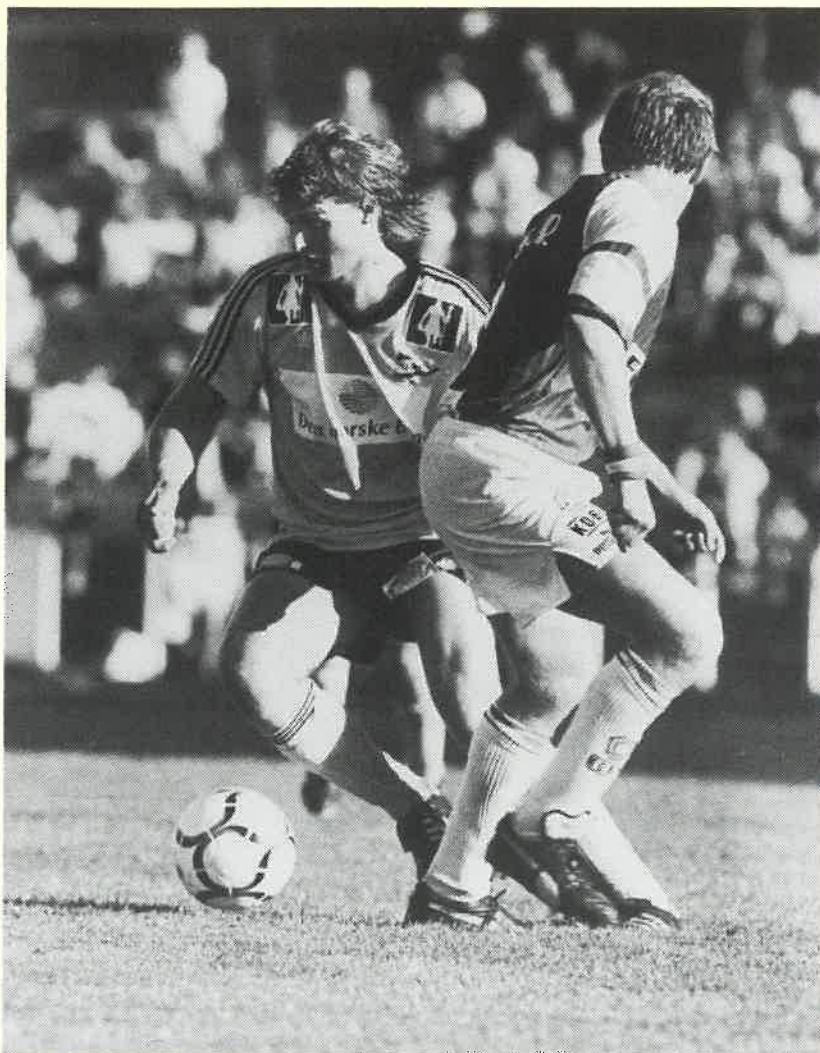
Stilstudie av årets toppscorer som er gjenstand for en enorm oppmerksomhet.

Det var Eik som ble for sterke i finalen på Briskeby på Hamar. Våre elleve sprakk i 2. omgang etter å ha kunnet ledet ved pause. Men i 2. omgang dominerte Eik og vant fortjent 3-0. Vårt eget juniorlag viste i enkelte kamper bra spill. Spesielt da Rosenborg ble beseiret 1-0 i semifinalen. Ellers ble blant annet VIF Fotball utklasset med 6-1 på veien til finalen.