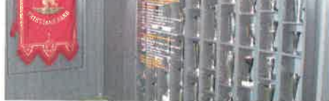
At Start er en klubb med rike tradisjoner vitner pokalutstillingen om.

informasjon. Her er det også et eget fotballspill, hvor man kan teste ut hvem i familien som har de beste spillerferdigheter i så måte.