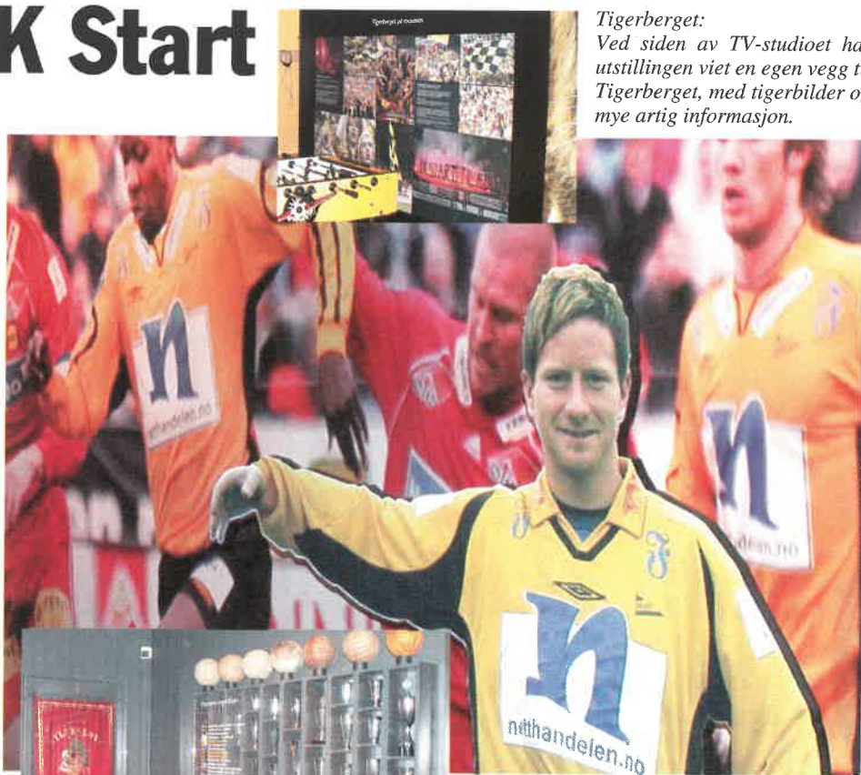
Tigerberget: Ved siden av TV-studioet har utstillingen viet en egen vegg til Tigerberget, med tigerbilder og mye artig informasjon.

Ved siden av TV-studioet har utstillingen viet en egen vegg til Menigheden supporterklubb, med tigerbilder og mye artig