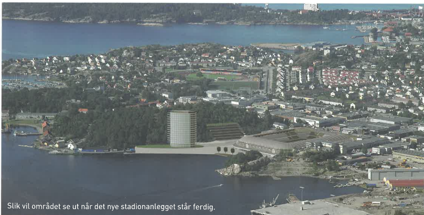
Slik vil området se ut når det nye stadionanlegget står ferdig.

- Vi er nå i ferd med å inngå avtale med en finsk stålentreprenør, så det hele tegner jo til å bli et ganske internasjonalt prosjekt. Alle elementene skal være på plass innen utgangen av oktober, sier Erik Geelmuyden.