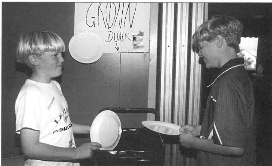
Deltakerne på fotballskolen var veldig flinke til å sortere avfall etter lunsjen i Starthallen. Alt av papp ble samlet for seg.

av kampen. Speaker setter miljøbølgen i gang. Ikke bare blir det ryddigere for publikum under kampen, men ryddingen etter kampen blir en lek i forhold til tidligere. Avfallet er nesten bare papp, slik at