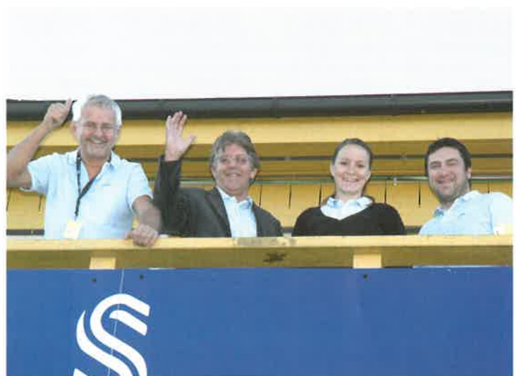
Disse arrangerer VIP-treff