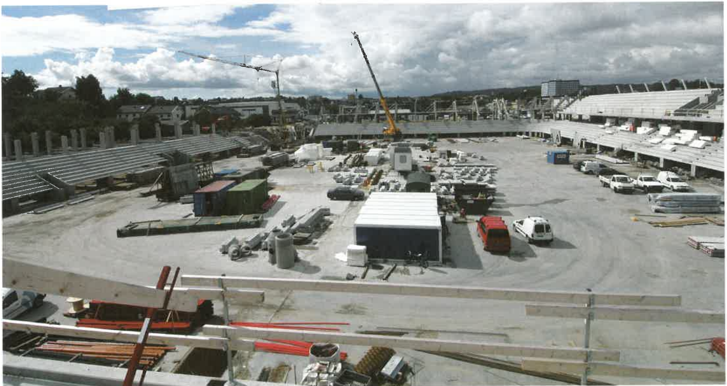
Glimt fra byggingen av stadion.