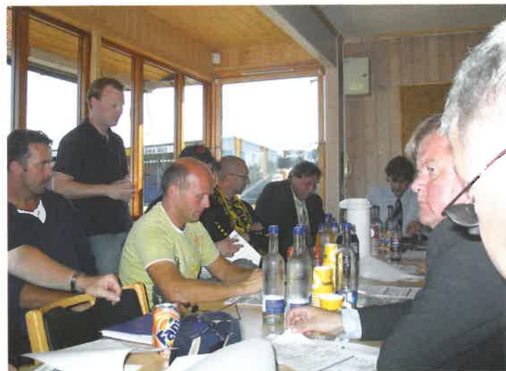
Grundig sikkerhetssjekk av arrangementet tre timer før avspark