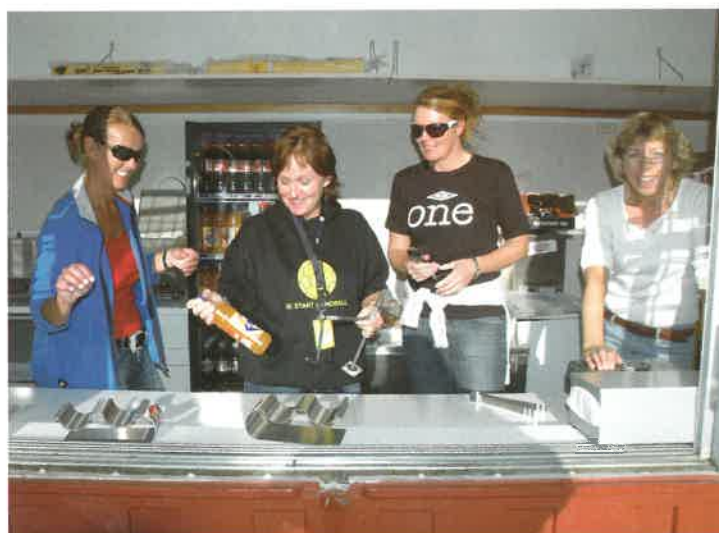
40 blide mennesker i kioskene rundt banen