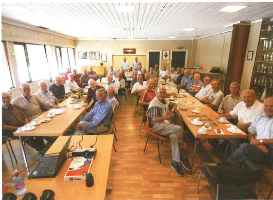
Med hjertet i Start – hele livet

«Tirsdagstreffet» består av menn som alle har sitt hjerte i Start. De fleste er medlemmer av IK Start, og ca 50 % av dem har hatt ulike verv i klubben. Enten som spillere, vakter på Stadion, styreverv eller lignende. Snittalderen er minst 75 år, og den eldste som har vært med var 92 år gammel. «Tirsdagstreffet» har bestått i ca 14 år og de får stadig nye medlemmer.