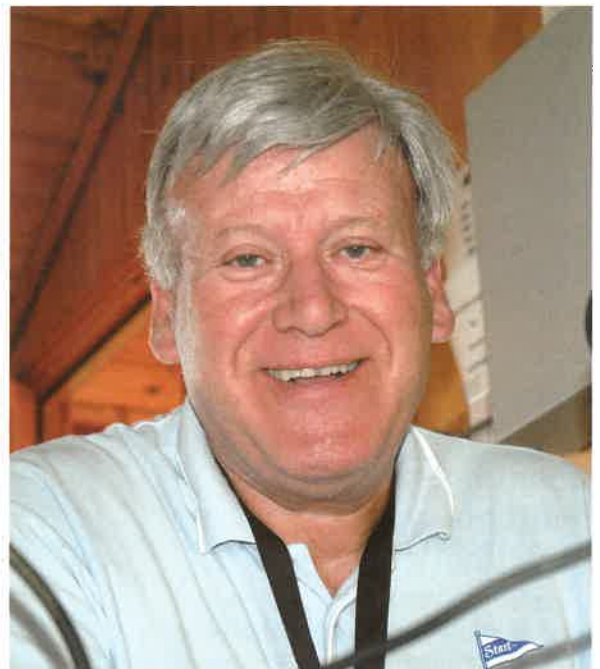
Per Svein Bostrøm – fotballstemmen fra Sørlandet