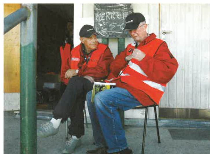
En pust i bakken før det braker løs