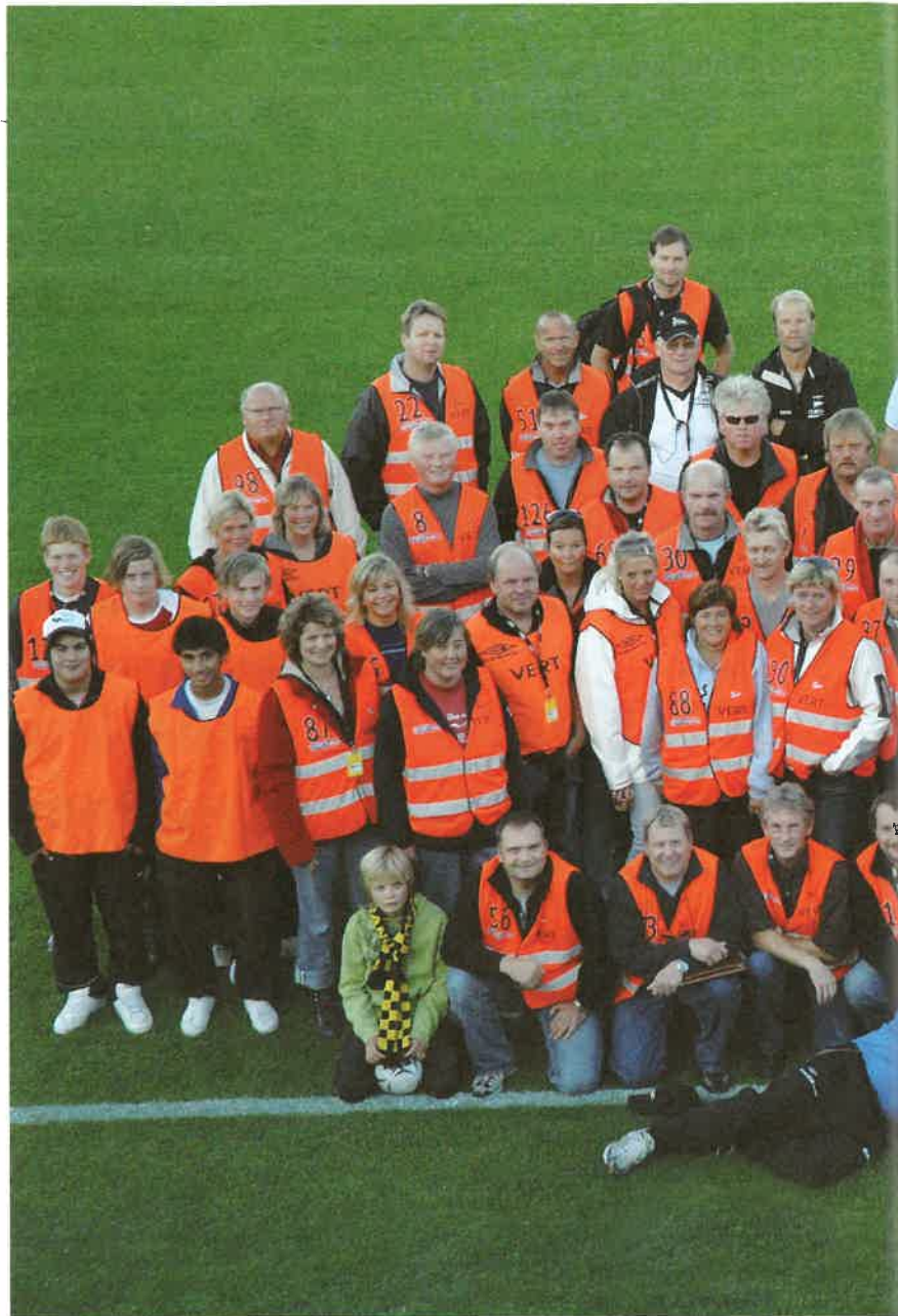
Alle vakter og verter på plass