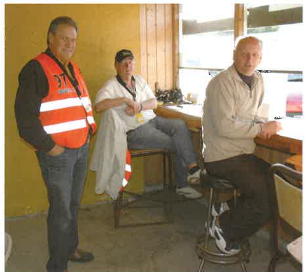
Og billetter må fortsatt selges...