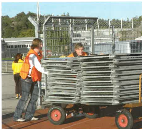
Det er mange reklameskilt som skal opp