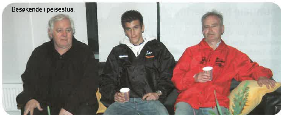
Besøkende i peisestua.

- Den nye miljøkomiteen er i startfasen av sitt arbeid. Den har drøftet enkelte tiltak som det kan være aktuelt å iverksette, og noe er allerede gjort. Medlemmene er for eksempel invitert til å besøke klubbens peisestue umiddelbart etter at hjemmekampene er slutt. Her kan de få kjøpe kioskvarer og hygge seg i påvente av reduserte køer ut fra stadionanlegget, sier Skuggen.