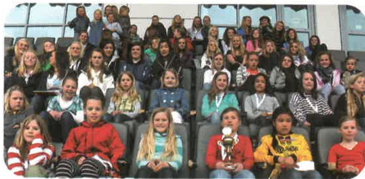
IK Starts håndballjenter samlet på Sør Arena.