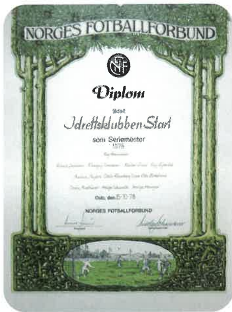
På veggen utenfor Start's peisestue på Sør Arena henger det synlige bevis på seriemesterskapet 1978