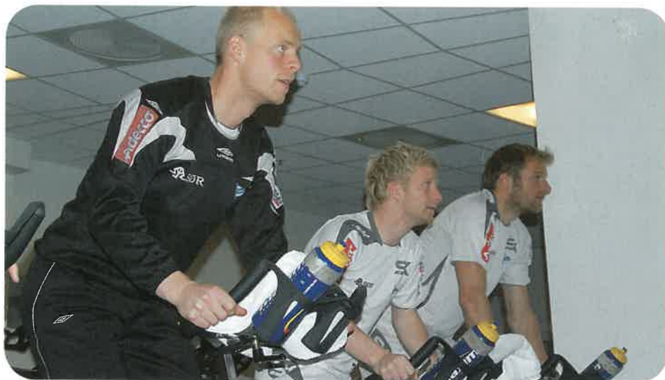
Startgutta restituerer etter gårsdagens kamp.

Her er det grei parkering, og man kan trene med en idyllisk utsikt mot sjøen. Enten man sykler, driver med vekter eller andre high-tech apparater. Et eget lekerom tar vare på barna mens mor eller far trener. Totalt dekker lokalene hele 2000 m 2 .