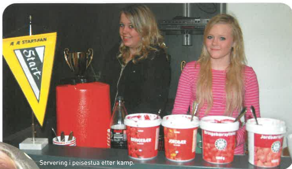
Servering i peisestua etter kamp.