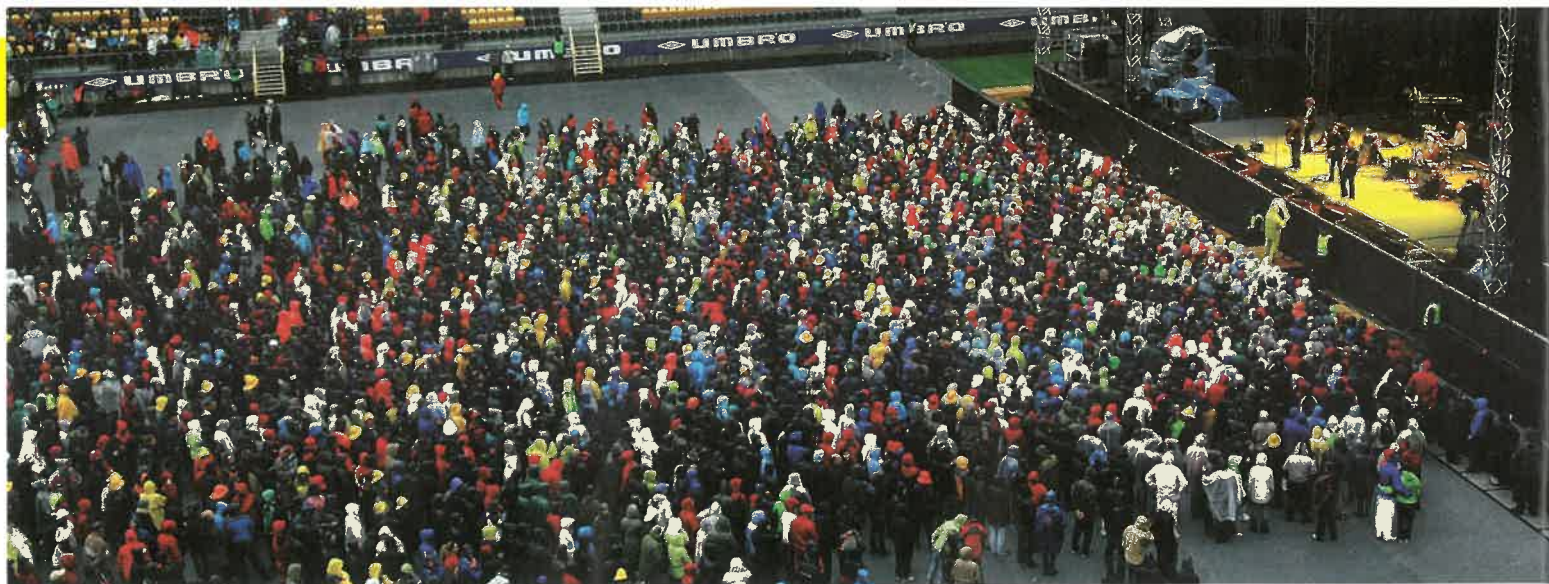
Elton John med oppvarmingsband på Sør Arena i 2007.