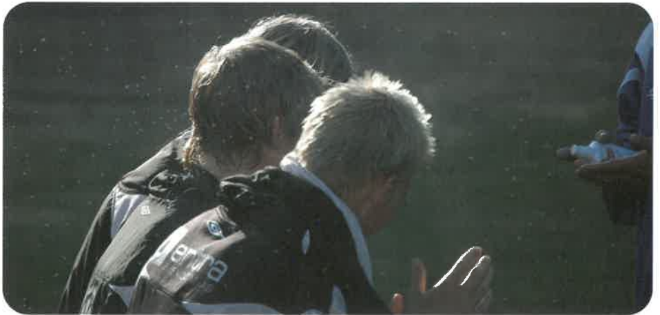
Knottangrep på Dønnestad.

- Det første gikk på hvorvidt gressmatta på Sør Arena ville tåle ekstra bruk. Den var jo rimelig frynsete i åpningsåret, og vi var svært usikre på