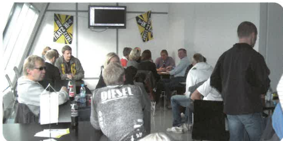
Club21 har et eget pauseområde på Sør Arena.