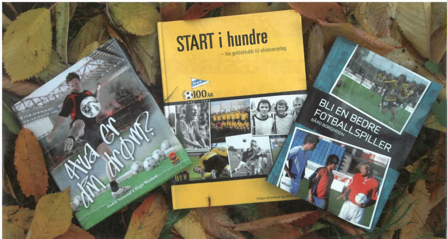
De tre nyeste Startbøker avbildet på høstgul bakgrunn