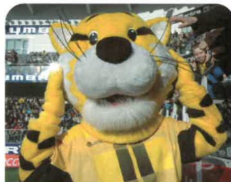
Starts nye maskot

Adresse: Industrigaten 1 (vis a vis Starthallen) - Åpningstider: Man-fre 09.00-17.00, lør 10.00-15.00 Tlf. 38 02 33 20 - sportsprofil@sportsprofil.no - www.sportsprofil.no