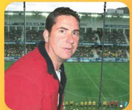
Her fra P4s kommentatorboks foran fjorårets kamp mot Vålerenga.