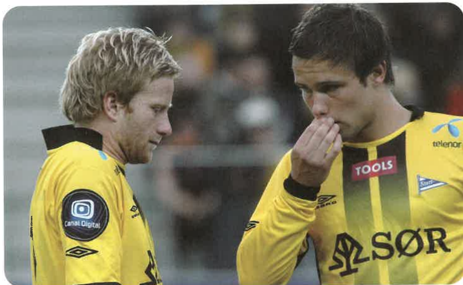
Selskapet eier alle kommersielle rettigheter knyttet salg av spillere.