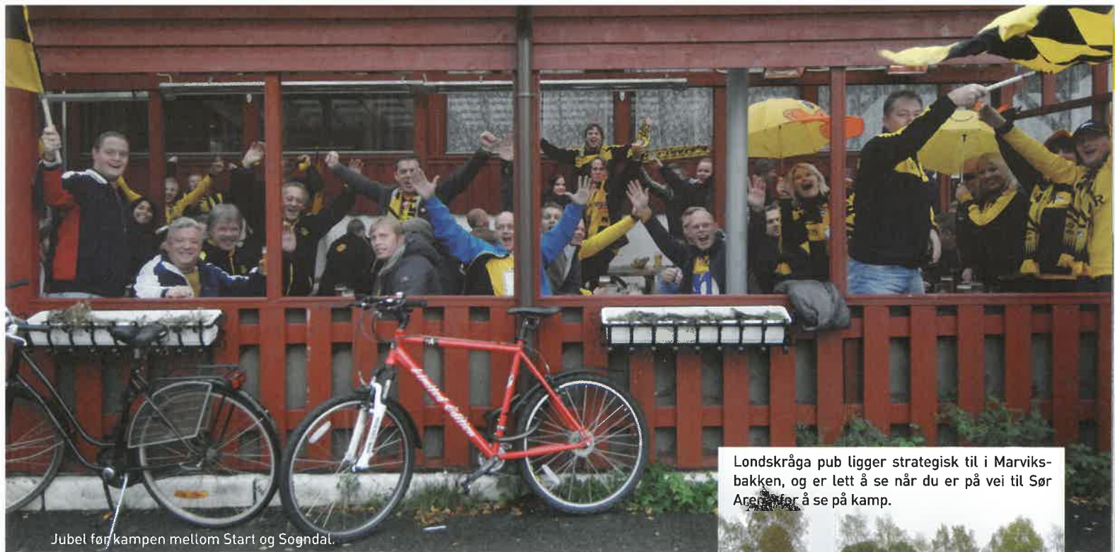
Jubel før kampen mellom Start og Sogndal.

Londskråga pub ligger strategisk til i Marviksbakken, og er lett å se når du er på vei til Sør Arena for å se på kamp.