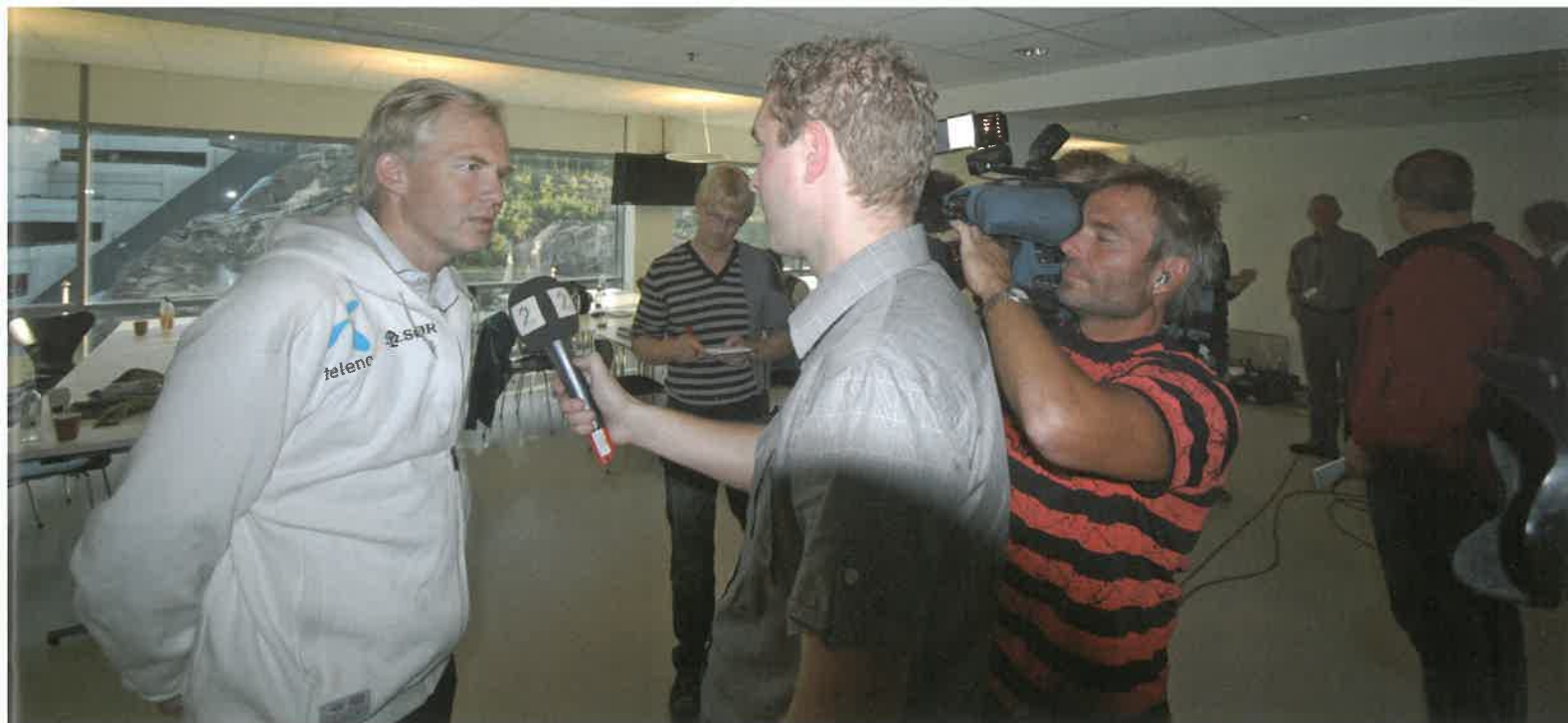
Harde dager for Start Toppfotballs ledelse. Her Skisland i medias søkelys.