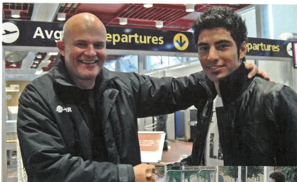
God tur til Tblisi, høsten 2007.