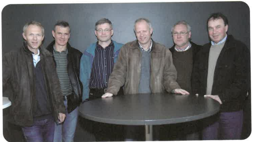
Noen av norgesmesterene fra 1974 samlet før kampen.