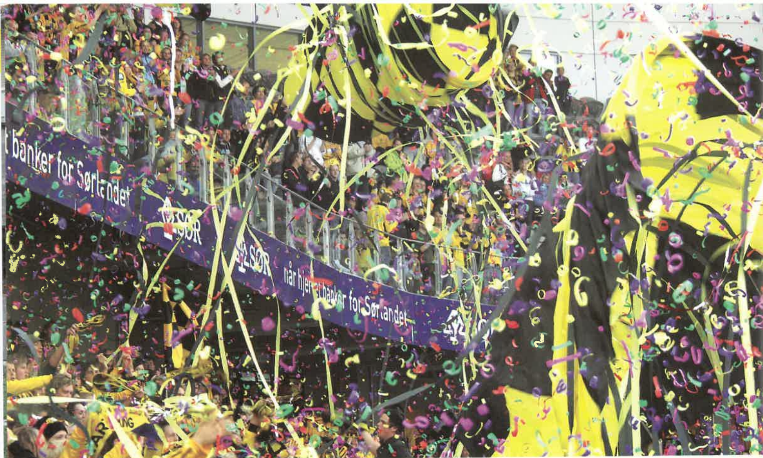
Menigheden med Tifo (tribunearrangementer utført av supporterer) før kampen.