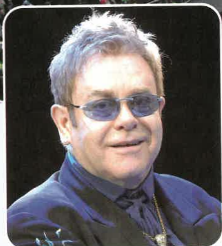
Sir Elton John på Sør Arena