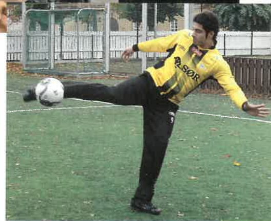
Målrettet trening har gitt resultater!

3. oktober; Et skritt på veien mot målet er nådd, landskamper for Norge og ja vi elsker på bortebane. Innkallingen ligger på kontorpulten min på Sør-Arena, treneren gjennom 9 år kan overlevere landslagsinnkallingen fra fotballforbundet i lunsjen i dag. Den kurdiske gutten fra små kår har tatt skrittene fra