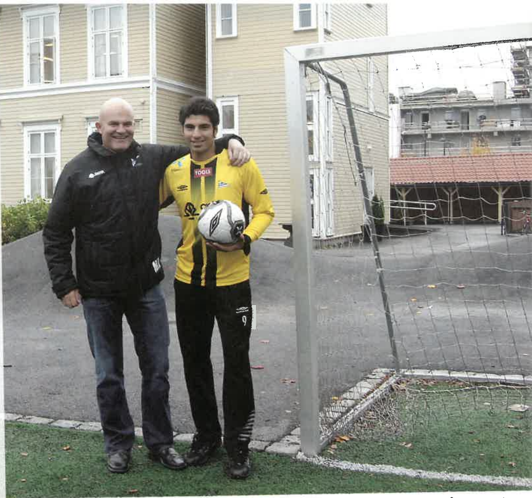
Her begynte det våren 1998.

Fullverdig medlem av A-stallen og ny 4 års kontrakt fra august 2007. 2 innhopp hittil i år, mot Haugesund i cupen og mot Ålesund i Tippeligaen.