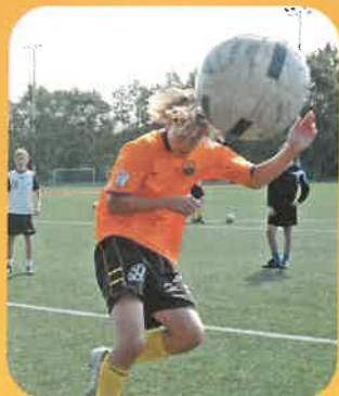
IK Starts talentutvikling