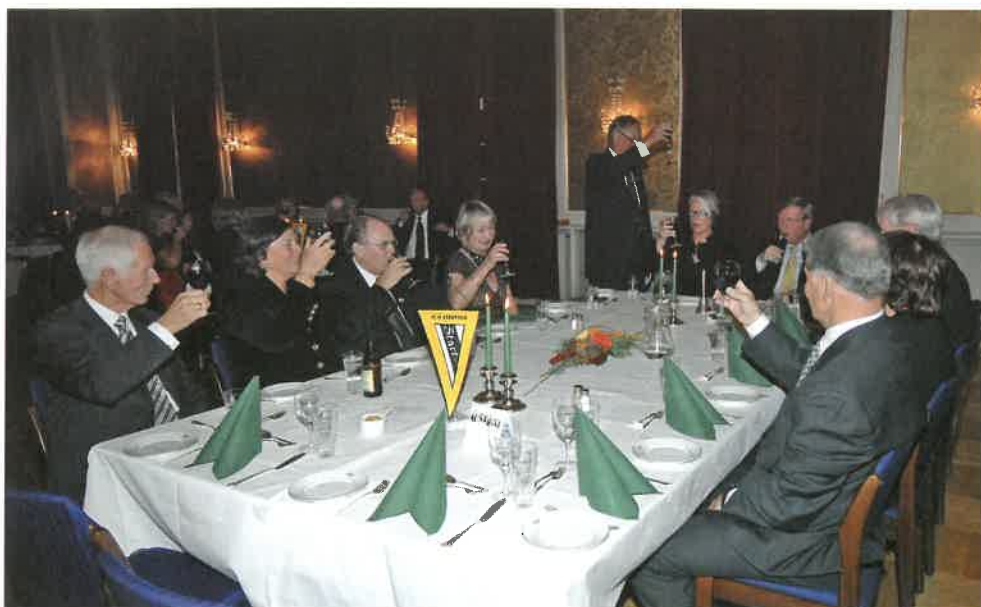
80 gjester samlet seg i «Klubbens» lokaler 3. november. Torskens skål utbringes!