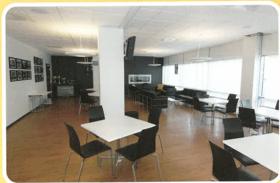
Klubbens peisestue må fylles med liv.

Vi har over en periode på noen uker spurt alle fotballinteresserte vi har møtt på vår