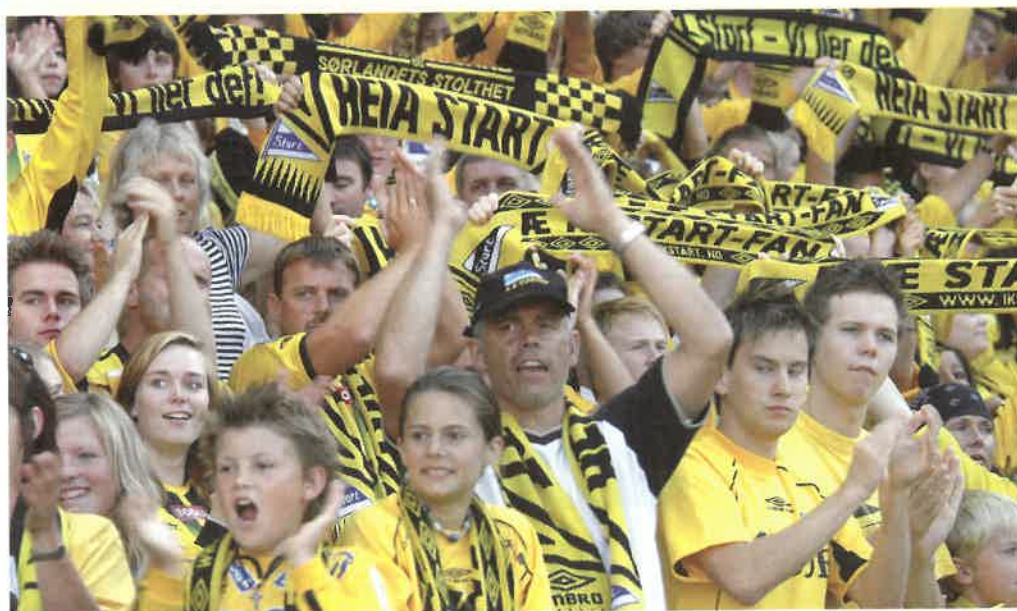
Ung og gammel får plass i Menighedens rekker

Vi driver med aktivt arbeid for å skape liv og en god atmosfære før, under og etter kamp. En fotballkamp er mer enn 90 minutter. Vi arrangerer også turer til bortekamper. Vær med og støtt spillerne også på bortebane.