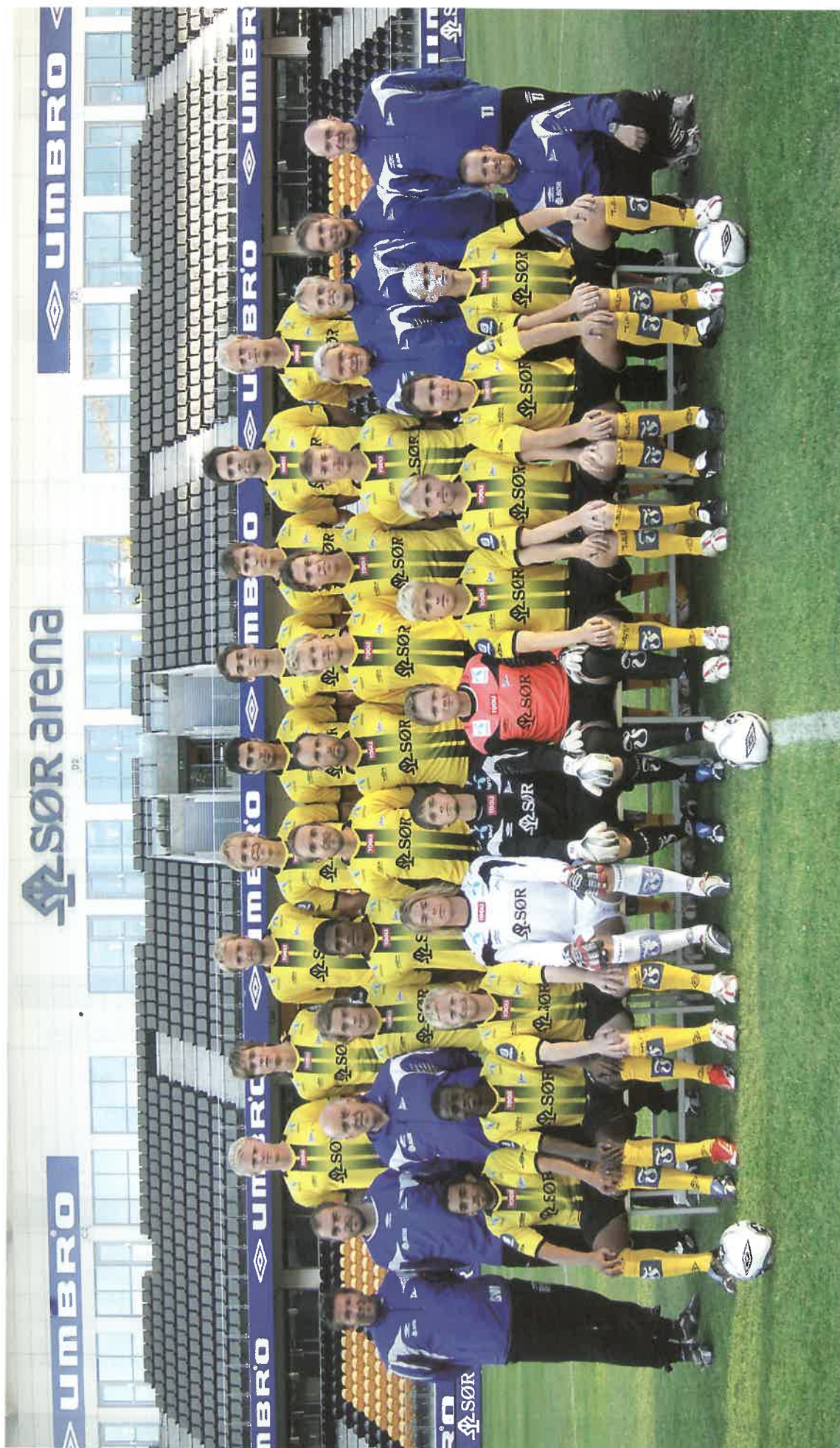
Lagbilde av stallen - på Sør Arena 13. september 2007.