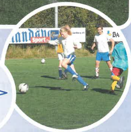
Ivrige spillere fra Oddemarka skole i sving på treningsfeltet

Under kampsesongen ble økten flyttet til lørdager slik at det ikke berørte ordinære treninger og kamper i klubbene. Dette gjorde at også interesserte trenere kunne følge noen av øktene. Øktene er såkalte lavintensitetsøkter og vektlegger i hovedsak basisferdigheter som teknikk, balanse, pasningsferdighet, innlegg, avslutninger og noe rolletrening. Dette krever konsentrasjon, kvalitet og presisjon av spillerne.