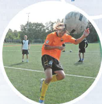
Fra talentgruppen: Riktige avslutninger krever konsentrasjon, kvalitet og presisjon av spillerne.