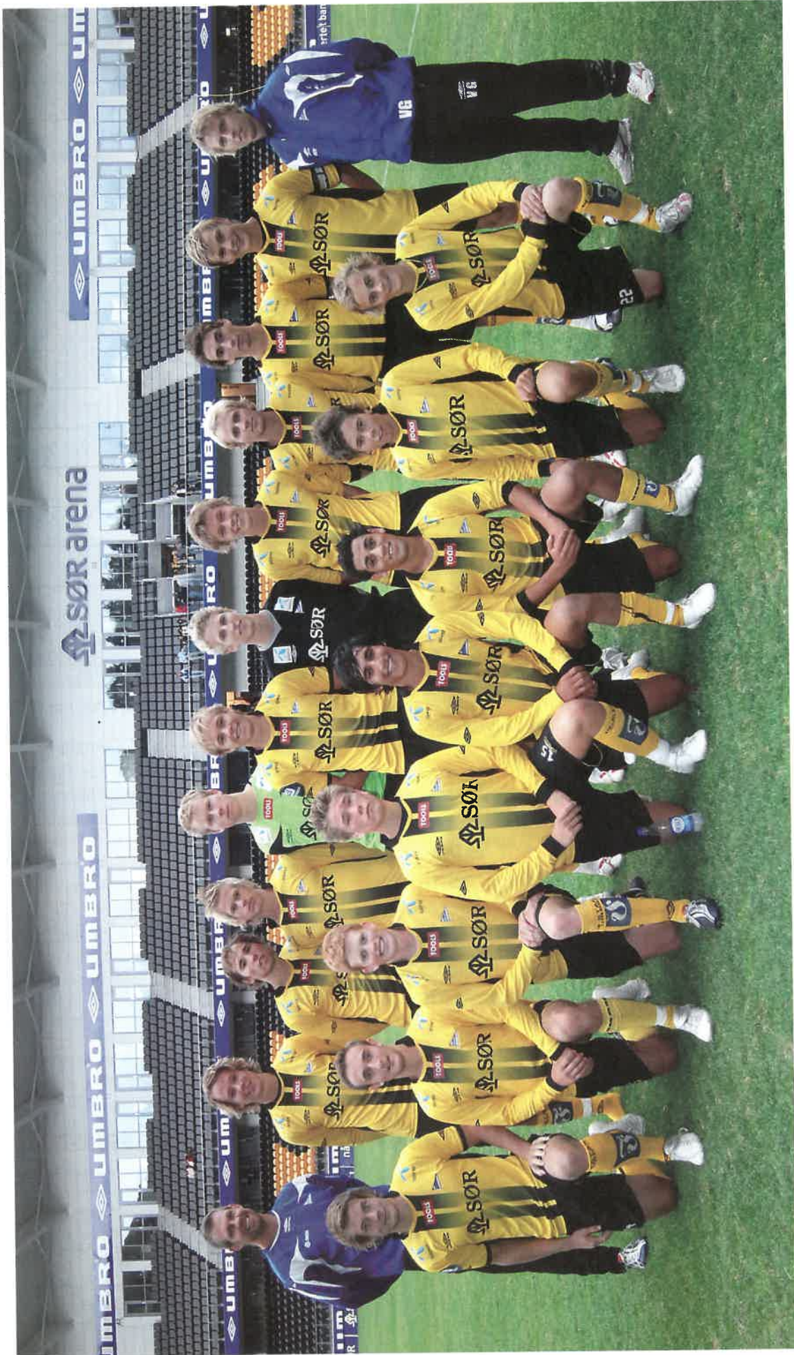
Lagbilde av juniorlaget som spilte kvartfinalen - Sør Arena 1. september 2007.