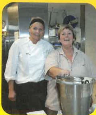
Man kan også fille magen på Sør Arena...