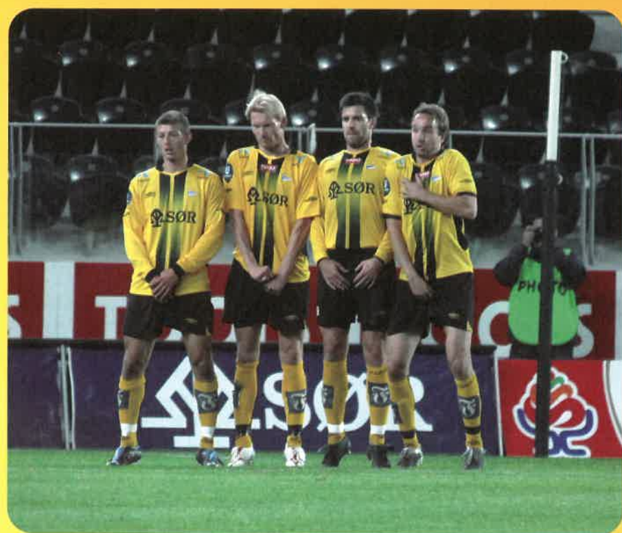
9.15 fra ballen takk!

Ved frispark skal alle motstanderens spillere stå 9.15 fra ballen. Barnelærdom, men hvorfor akkurat disse 915 cm?