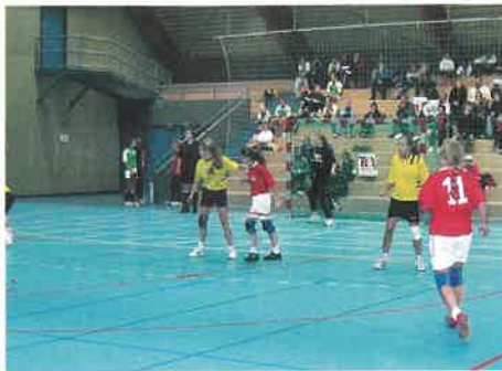
Start jenter 15 forsvarer seg i kampen mot AK-28 i Troll-cupen.