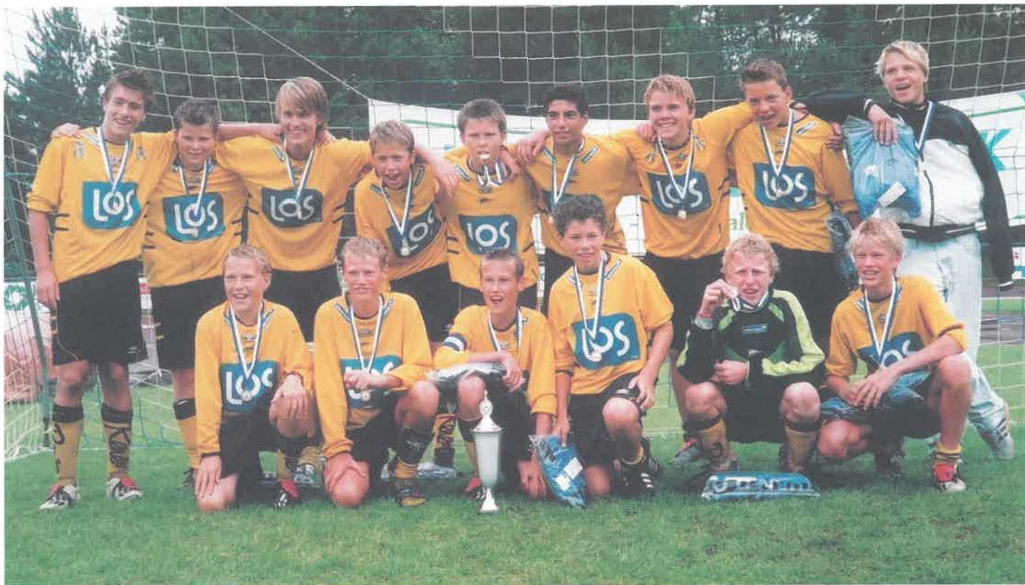
Småguttelaget som ble suverene vinnere av Kattegat Cup 2003.