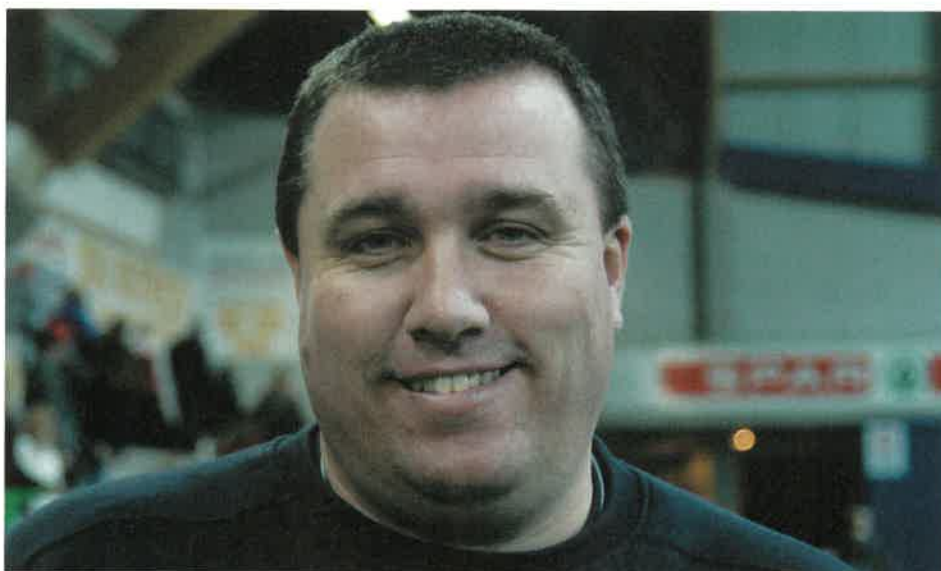
Smilende etter nest siste kamp med Sandefjord, mot Start i Sørlandshallen.

Han forlanger og krever, snakker mye og vil ha suksess. Han hater å tape. Han kommer med en spillestil som ligger nært opp til det som noen vil kalle Start-stilen, uten at den er definert nærmere. Det handler om å angripe, bruke kantene og pøse på, når det er mulig. Samtidig krever Nordlies system at Start lukker døra der bak, at det defensive er organisert og sikkert. Ikke noe revolusjonerende, men spennende som bare det.